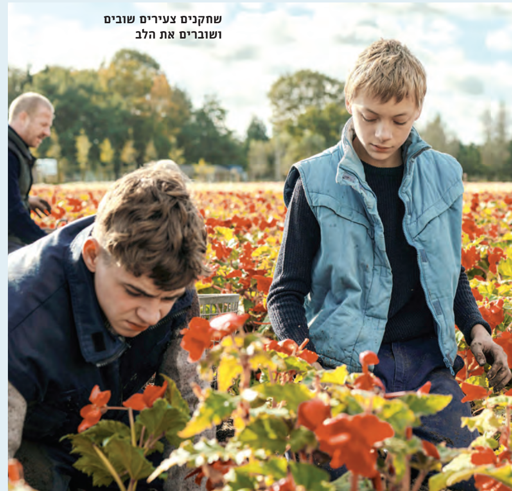
שחקנים צעירים שובים ושובים את הלב