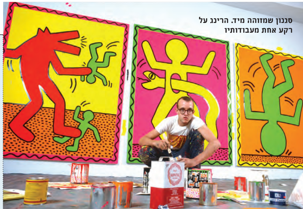
סגנון שמזוהה מיד. הרינג על רקע אחת מעבודותיו